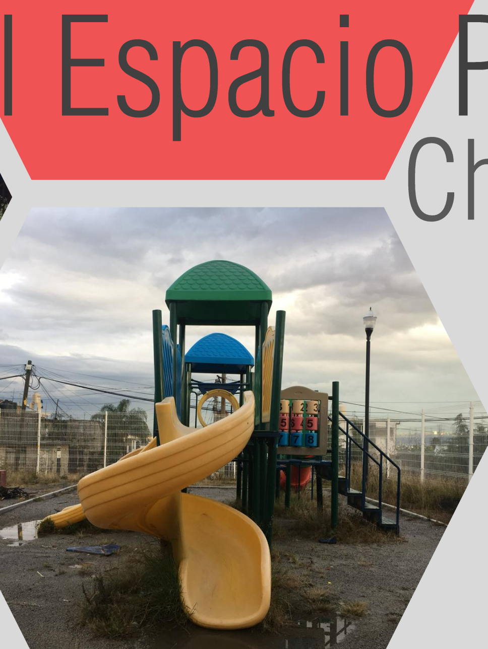
Fotografía 01, 02: Espacios de recreación en Morelia