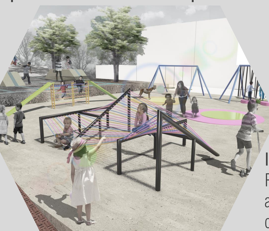
Imagen 01,02,03: Propuesta de Espacio transformado al implementar PADE y objetos transformados en este caso el sube y bajas

Ante tal evento, desde la perspectiva de diseñador se observa un nicho de oportunidad en donde se pueden plantar nuevos escenarios manipulando lo construido , implementando procesos de diseño que sean incluyentes con los niños.