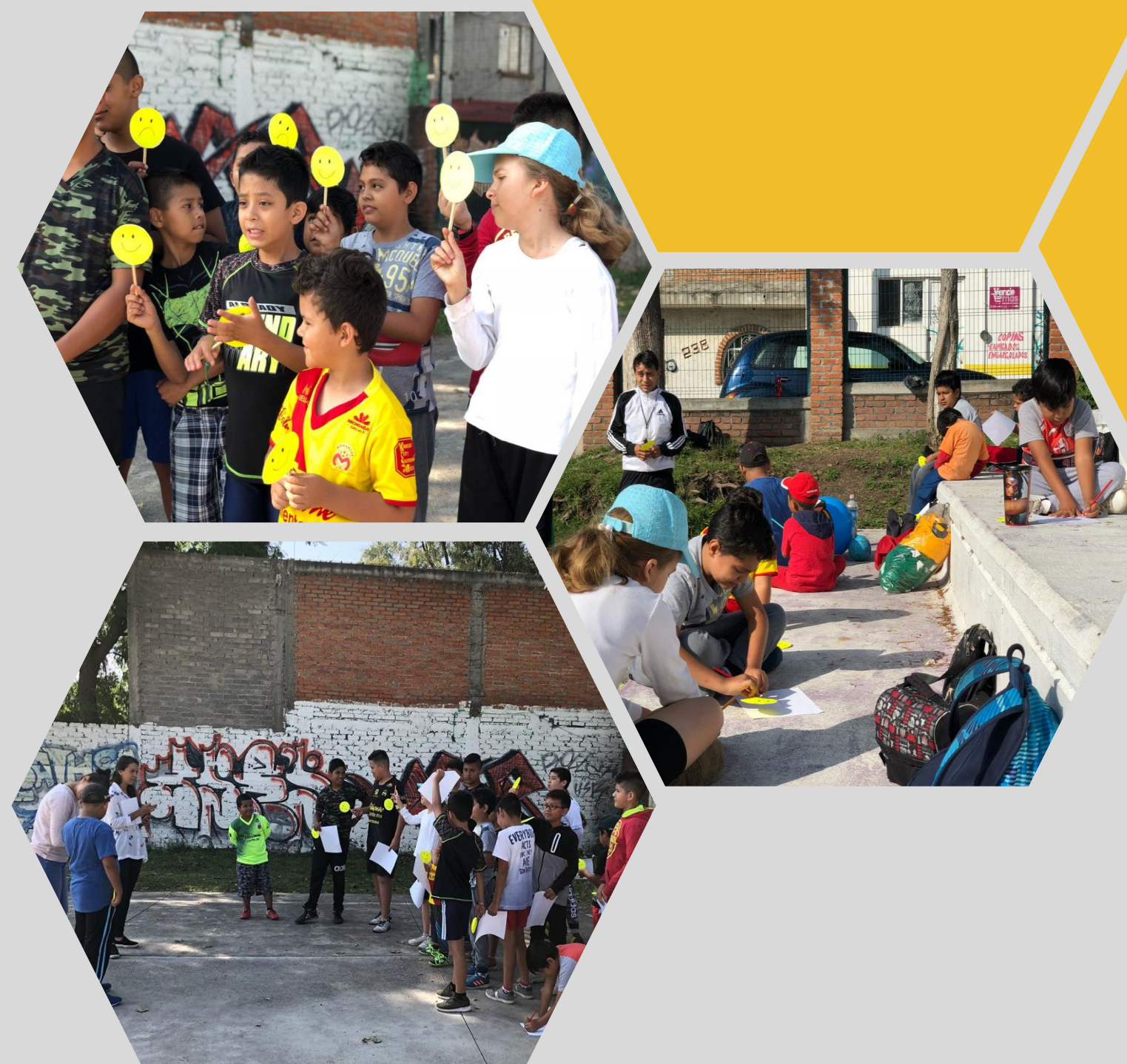
Fotografía 03,04,05: Implementación PADE

El diseño de PADE se pensó con la idea de explorar un espacio construido , midiendo la apropiación de los niños para poder plantear una propuesta de transformadora y/o diseñar nuevos escenarios en lo construido .