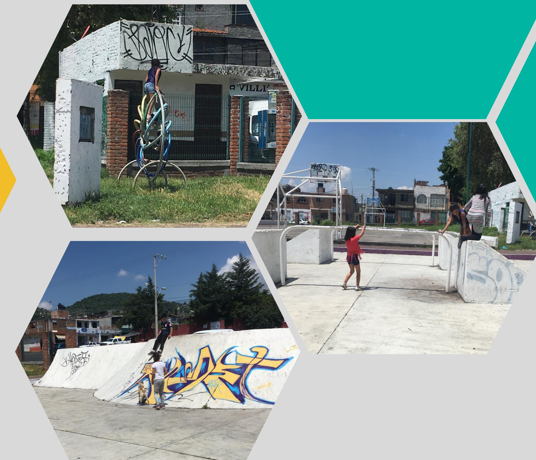
Fotografía 06,07,08: Implementación PADE

Teniendo como resultado que el espacio recreativo implementado para el recrear y juego de los niños, la permanencia en su área es baja y el uso de los juegos fijos, observándose además que la mayoría de los niños buscaban espacios y objetos menos definidos, creando su propia experiencia .