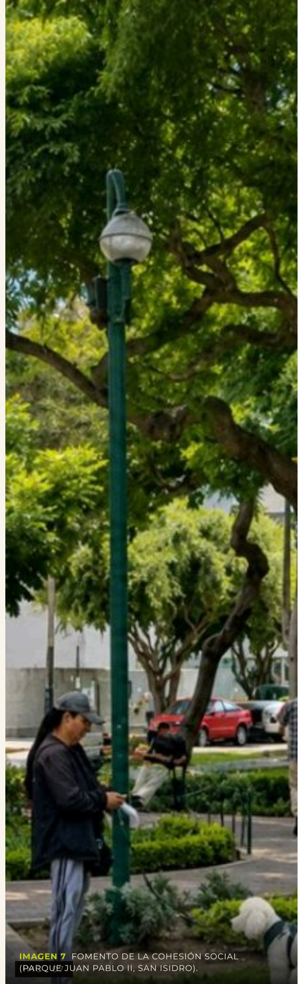
IMAGEN 7 FOMENTO DE LA COHESIÓN SOCIAL (PARQUE JUAN PABLO II, SAN ISIDRO).

alcanzan el mismo nivel de confort y sofisticación. La brecha es menos visible que en periferias en consolidación, pero más estructural. Se trata de una desigualdad acumulativa que, con el tiempo, refuerza diferencias territoriales dentro de la misma Lima Consolidada.