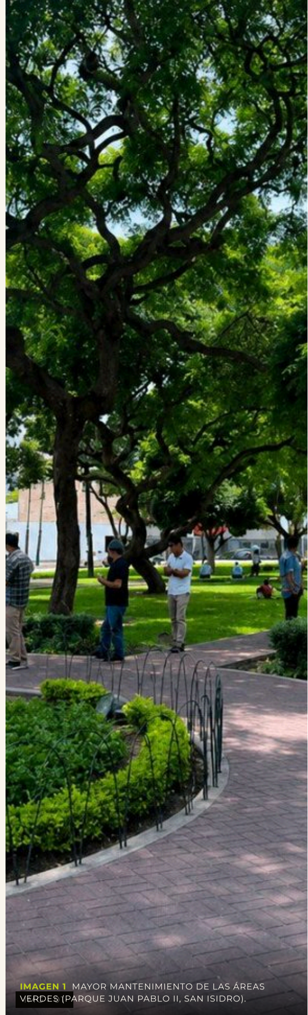
IMAGEN 1 MAYOR MANTENIMIENTO DE LAS ÁREAS VERDES (PARQUE JUAN PABLO II, SAN ISIDRO).

Arquitecto especializado en planificación urbana, paisajismo y gestión del espacio público en contextos latinoamericanos. Lima, Perú · 2026.