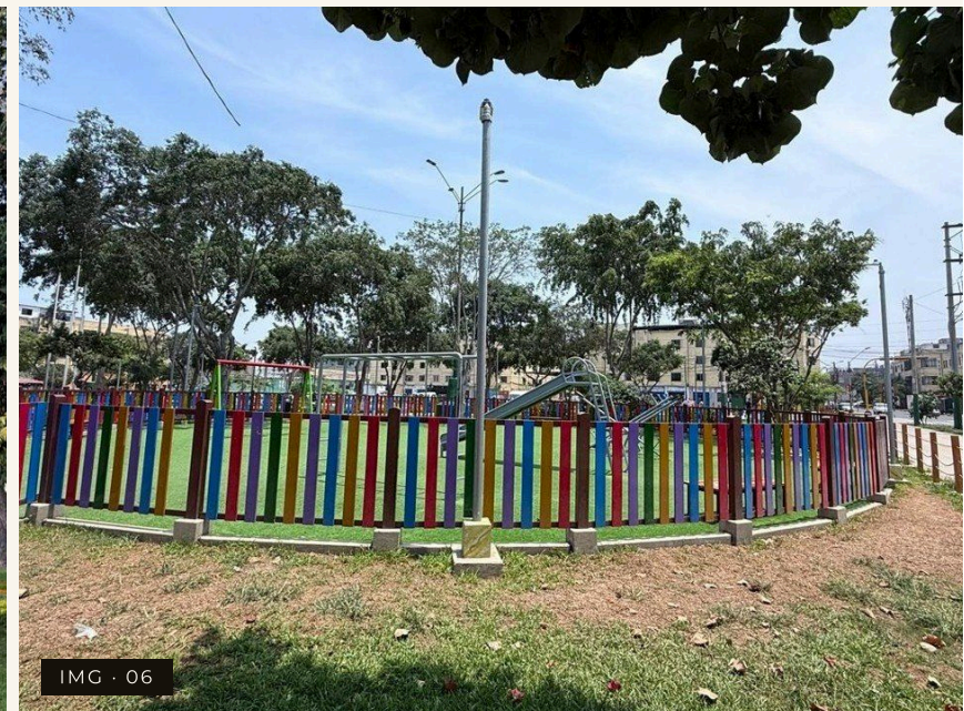
IMG · 06