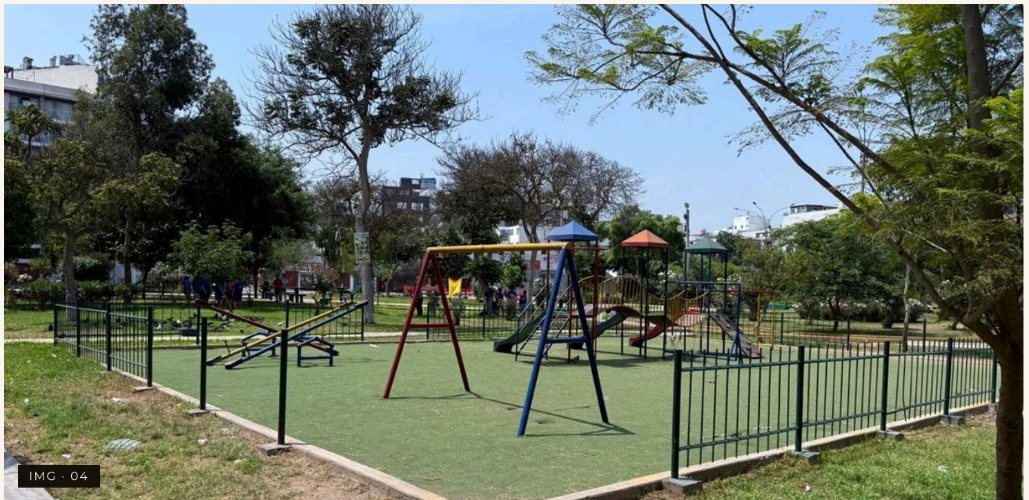
IMG · 04

Estas diferencias no siempre son dramáticas, pero generan una brecha acumulativa en la experiencia urbana.